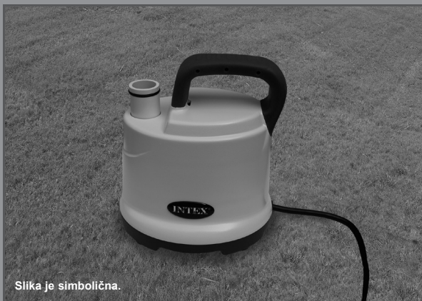
Slika je simbolična.

Maks. Višina 2.5 m, Min. Višina 0.01 m, IPX8