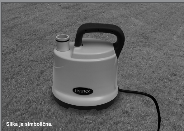
Slika je simbolična.

Maks. Višina 2.5 m, Min. Višina 0.01 m, IPX8